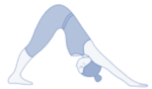
Adem uit omlaagkijkende hond