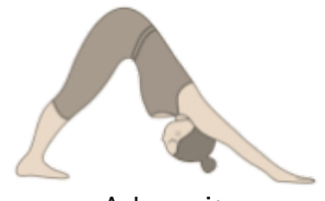
Adem uit omlaagkijkende hond