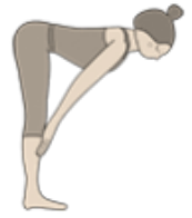
Adem in plaats handen op knieën maak rug lang en kijk vooruit